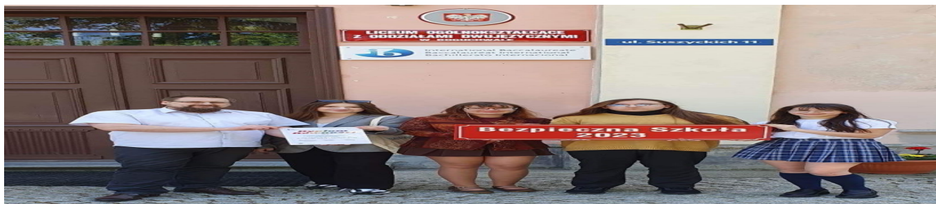
Bezpieczna Szkoła 2023 zdjęcie