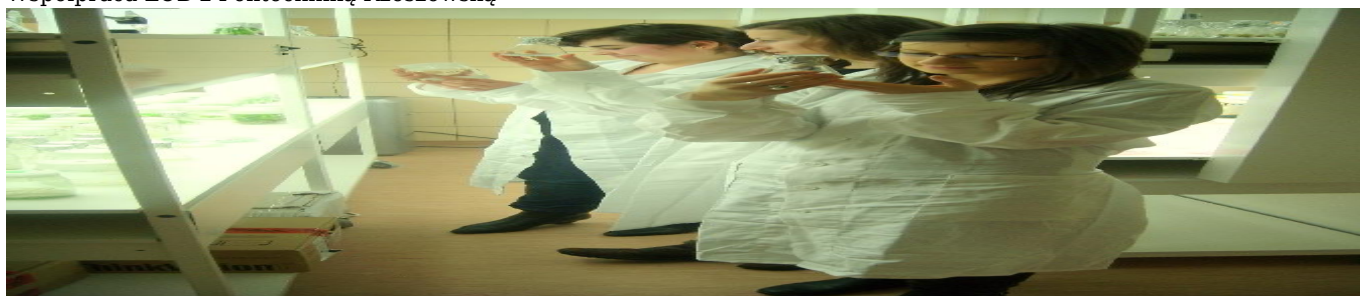
Współpraca LOB z Politechniką Rzeszowską zdjęcie 2