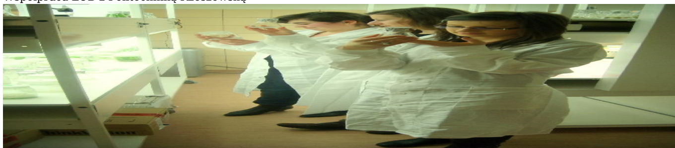
Współpraca LOB z Politechniką Rzeszowską zdjęcie 2