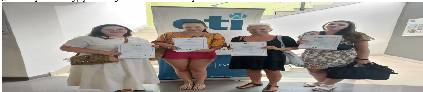
„Bliskie spotkanie z językiem angielskim na Malcie” zdjęcie 3