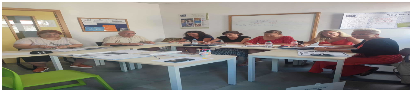
„Bliskie spotkanie z językiem angielskim na Malcie” zdjęcie 1