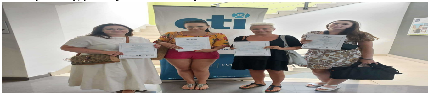
„Bliskie spotkanie z językiem angielskim na Malcie” zdjęcie 3