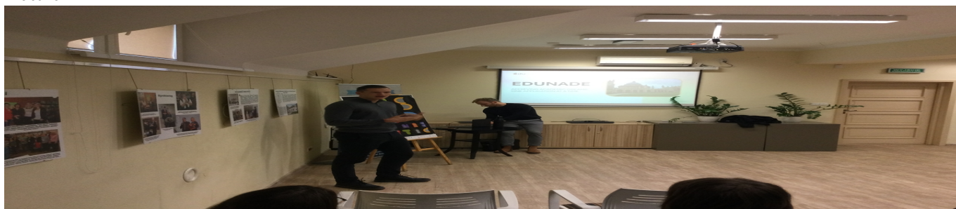
Matura IBDP 3