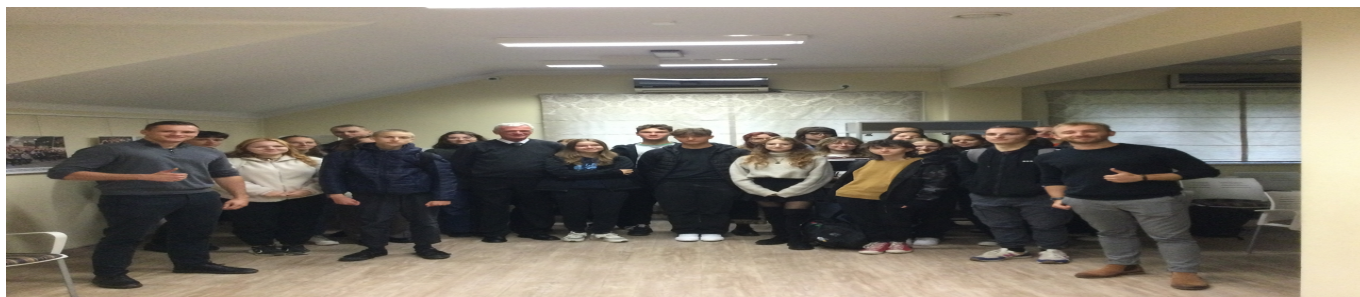
Matura IBDP 1